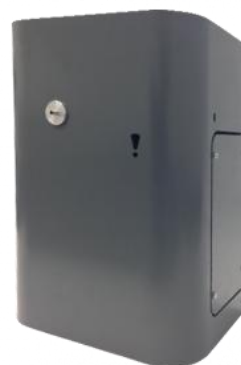
Генератор тумана АВАРКО ИЗИ