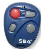
Радиобрелок БЛ СЕА

Генератор тумана может быть подключен к охранной сигнализации и выполнять функцию защиты, активируясь при переходе сигнализации в режим «тревога».