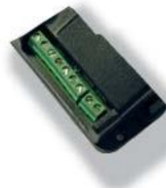
Приемник СЕА ФЛЕКС ЮНИ