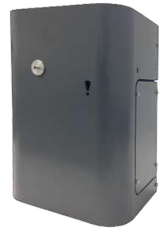
Генератор тумана АВАРКО ИЗИ