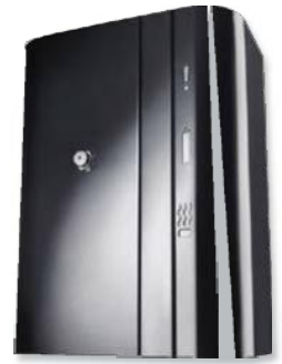
Генератор тумана АВАРКО ФАСТ ПРО 02 2С

Для решения задачи предлагается оснастить помещение базовой станции сотовой связи генератором тумана. Запуск генератора тумана будет производится от существующей системы охранной сигнализации.