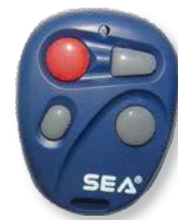
Радиобрелок БЛ СЕА