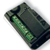
Приемник СЕА ФЛЕКС ЮНИ